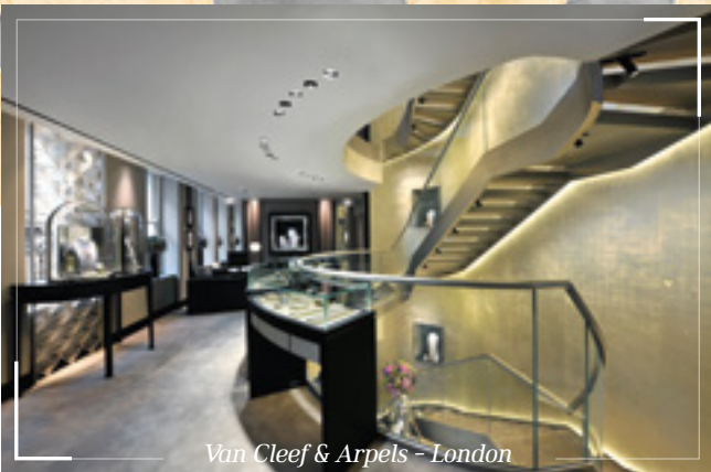
Van Cleef & Arpels - London