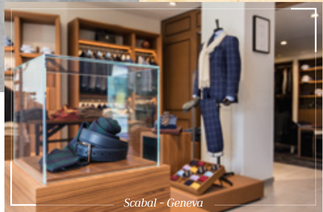
Scabal - Geneva