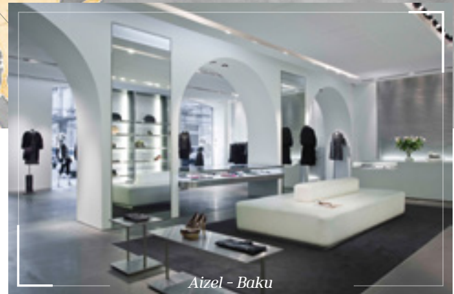
Aizel - Baku

sche Anforderungen werden hierbei berücksichtigt: Beispielsweise erlaubt Australien aus artenschutzrechtlichen Gründen nur die Einfuhr von insektenfreien Transportkisten. Daher verlassen bei Hoffmann Interior nur Kisten aus thermisch behandeltem Holz das Werk nach „Down Under“.