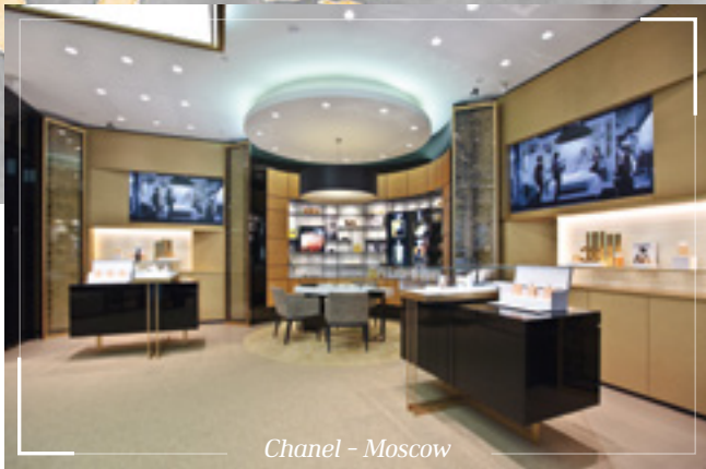
Chanel - Moscow